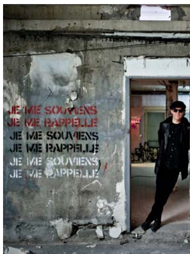
Portrait de Jef Aérosol - © Stéphane Bisseuil (détail)