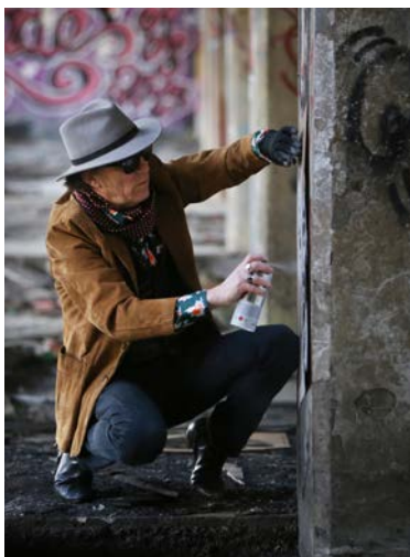
Portrait de Jef Aérosol