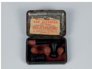
Bouchons d'oreilles, 1916, Royaume-Uni, collection Historial de la Grande Guerre