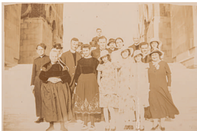
Photographie d'un pèlerinage à Thiepval, 1933, France

Ouvert en juin 2016, le musée est consacré à l'Histoire des batailles de la Somme, en particulier à celle de 1916, et à la mémoire des soldats disparus. La déclinaison de l'exposition questionne l'apparition des pèlerinages notamment à travers l'exemple du Mémorial de Thiepval et explicite les codes des cimetières militaires allemands, français et britanniques.