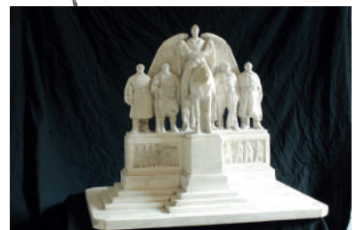
Maquette en plâtre, Emile Pinchon, non datée, France, collection Historial de la Grande Guerre

« Les monuments aux morts font partie de notre culture (...) mais il ne viendrait l'idée à personne de leur attribuer un caractère exceptionnel : leur présence va d'elle-même. »