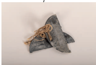
Double plaque d'identité, non datée, France, collection Historial de la Grande Guerre