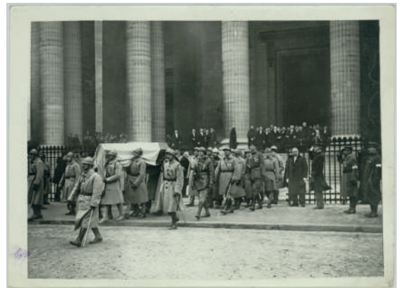
Photographie montrant le cercueil du Soldat inconnu à la sortie du Panthéon, 1920, France, collection Historial de la Grande Guerre