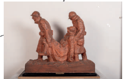
Maquette en plâtre « La dernière étape », Edmond Delphaut, non datée, France, collection Historial de la Grande Guerre

Après le conflit, tous les belligérants construisent des monuments aux morts. En France, quasiment toutes les communes possèdent leur monument aux morts, qui devient le lieu traditionnel des rassemblements. Cette séquence propose de découvrir comment ces monuments ont été construits. Quels emplacements ? Quels financements ? Quels réalisateurs ? Quels messages ?