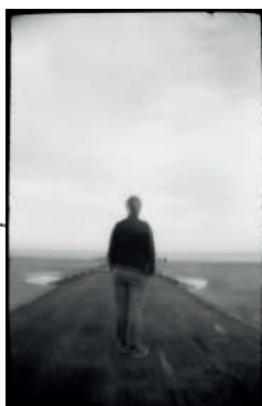
Beaumont-Hamel, Somme, 2019

La séquence propose aussi de découvrir le travail des photographes «Deux Dames en Van», à travers huit photographies de lieux mémoriels emblématiques.