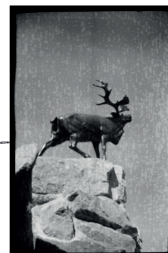
Nieuwport, Belgique, 2018