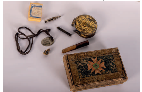
Ensemble de petits objets ayant appartenu à Maurice Runacher dont une balle de Shrapnel, non daté, France, collection Historial de la Grande Guerre