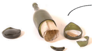
Bouteille en verre contenant un message en allemand, 1915, Allemagne, collection Historial de la Grande Guerre. Cette bouteille est trouvée lors du déménagement du monument aux morts de Chaulnes en 1990-1991. Elle contient un message datant de 1915.

La séquence propose aussi de découvrir le travail des photographes «Deux Dames en Van», à travers huit photographies de lieux mémoriels emblématiques.