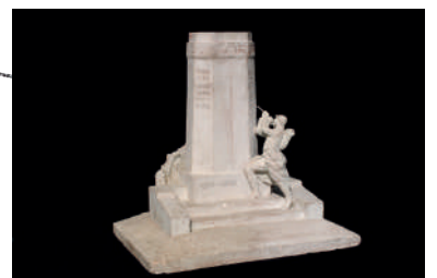
Maquette du monument aux morts de Ham (80), société granitière Gaudier-Rembaux, non datée, France, collection Historial de la Grande Guerre

Antoine Prost, 36 000 Cicatrices, catalogue d'exposition, 2016