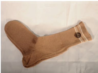
Chaussettes, non datées, France, collection Historial de la Grande Guerre

Espace d'introduction et de conclusion, cette séquence est organisée autour d'un dispositif audiovisuel. Des spécialistes de la mémoire et membres du comité scientifique de l'exposition proposent de courtes interventions en vidéo sur un aspect de la mémoire.