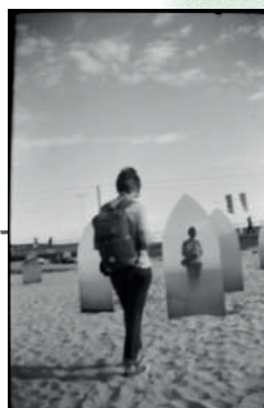
Middelkerke, Belgique, 2018