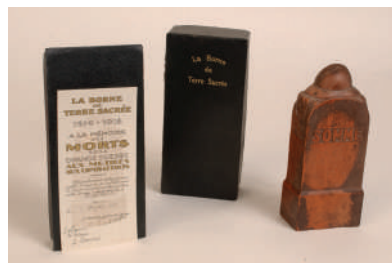
Borne de terre souvenir « Somme », 1927, France, collection Historial de la Grande Guerre

Le nombre massif de morts conduit à adopter de nouveaux modèles de nécropoles et cimetières militaires sur les lieux de bataille. Les familles des défunts se rendent sur les lieux de sépulture lors de pèlerinages. À ces pèlerins s'ajoutent touristes et curieux qui participent à l'émergence du tourisme de mémoire de la Première Guerre mondiale. Cette séquence met en lumière les acteurs actuels du tourisme de mémoire des batailles de la Somme.