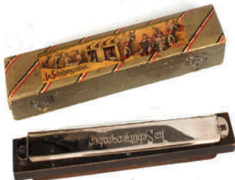
Harmonica Hohner, non daté, Allemagne, collection Historial de la Grande Guerre