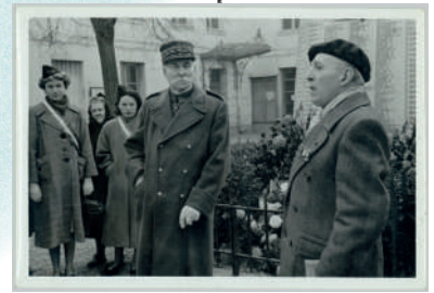
Photographie montrant une allocution devant le monument aux morts de Villejuif, non datée, France, collection Historial de la Grande Guerre

COMMENT OFFRIR UN LIEU DE RECUEILLEMENT POUR DES MILLIONS DE MORTS ET DISPARUS RESTÉS DANS LES ANCIENNES ZONES DE COMBAT ?