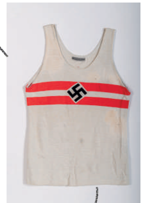
Maillot de sport pour garçon des jeunesses hitlériennes, 1933, Allemagne, collection Historial de la Grande Guerre