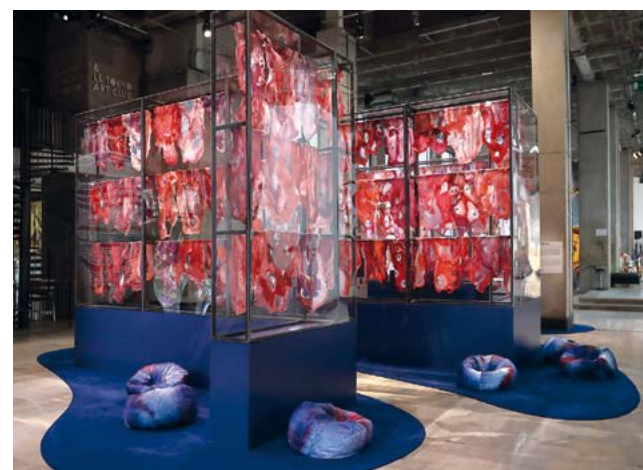
DE QUI SONT CES MANCHES Sabrina Vitali, 2018

Déployé au cœur de l'établissement, le dispositif est pensé comme un lieu de dialogues, d'échanges et de porosités entre tous les acteurs de l'école. Il s'agit de la réactivation d'une installation intitulée De qui sont ces manches , exposée pour la première fois au Palais de Tokyo à Paris de juin à septembre 2018. Dans ce lieu de recherches, de sédimentations, l'artiste explore avec les étudiants la question de l'écologie d'une oeuvre éphémère et mutante.