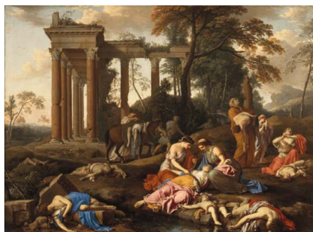
LA MORT DES ENFANTS DE BÉTHEL Laurent de la Hyre (1606-1656)