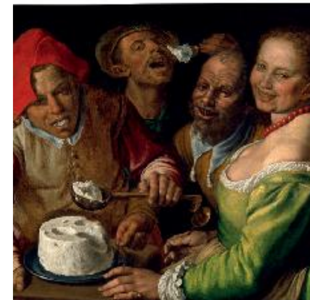
Vincenzo Campi , Mangeurs de ricotta , 1580. Huile sur toile, 77,9 x 89,4 cm. Lyon, musée des Beaux-Arts - Inv. H. 673