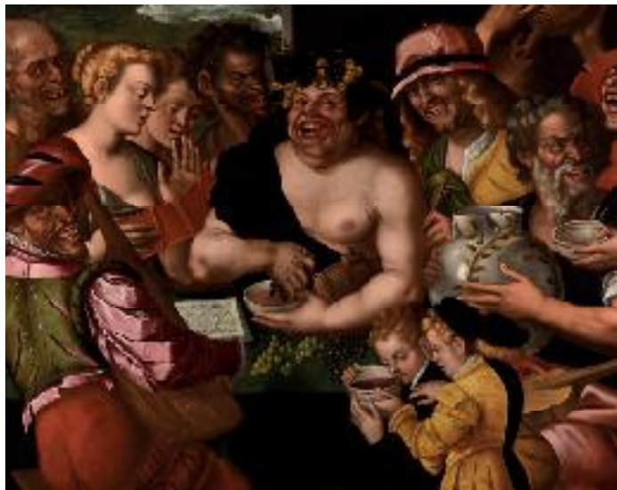
Niccolò Frangipane (entourage de), Scène bachique, vers 1580 (?). Huile sur toile, 119 x 153 cm. Soissons, musée Saint-Léger - Inv. 93.7.2704

Merci de nous envoyer une copie de l'article : Musée de Soissons, Abbaye Saint-Jean-des-Vignes, Logis de l'Abbé, 02200 Soissons