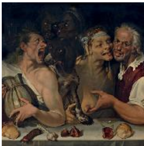
Bartolomeo Passerotti, Banquet caricatural (ou Joyeuse compagnie ), vers 1577. Huile sur toile, 114 x 118 cm. Paris, coll. part. © Suzanne Nagy.

Les rares peintures comiques parvenues jusqu'à nous ne rendent compte que très partiellement du succès de ce phénomène tout au long du XVI e siècle – un succès dont témoignent la lecture des inventaires et le nombre incalculable de copies et d'adaptations produites à partir de prototypes créés par Frangipane, Vincenzo Campi ou Bartolomeo Passerotti. Le corpus de neuf tableaux qui a pu être rassemblé à l'occasion de cette exposition, numériquement restreint, est important compte tenu de l'extrême rareté des œuvres conservées dans le registre choisi. A l'exception des Quatre personnages riant avec un chat du musée des Beaux-Arts d'Angers, plus précoce, et des deux toiles du Mans, légèrement plus tardives, toutes ont été créées autour de la décennie 1580 en Italie du Nord et leurs auteurs, identifiés ou non, appartiennent à une sphère culturelle commune marquée par la prégnance de la culture vénitienne, l'appropriation des modèles flamands, l'héritage de Léonard de Vinci et les facéties burlesques du poète Teofilo Folengo. L'exposition offre un panorama représentatif permettant d'appréhender la richesse sémantique d'un sujet qui cristallise des questionnements aussi multiples que complexes. Une savoureuse occasion de clore cette « saison italienne » en Picardie !