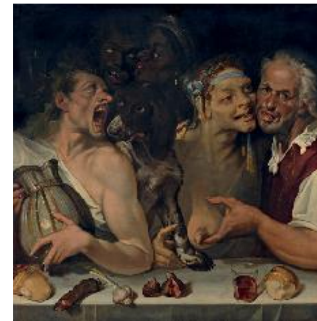
Bartolomeo Passerotti , Banquet caricatural ou Joyeuse compagnie , vers 1577. Huile sur toile, 114 x 118 cm. Paris, coll. part.