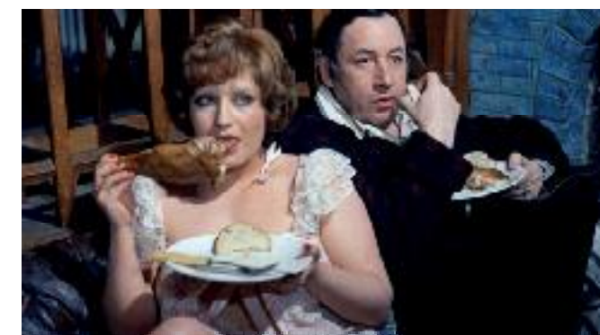
Scène du film La Grande bouffe