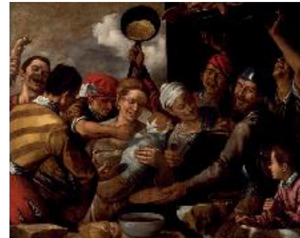
Anonyme (Venise), Le Chat emmailloté ou La Bouillie du chat, vers 1580-1590. Huile sur toile, 93,5 x 117,5 cm. Nantes, musée d'Arts - Inv. 294.