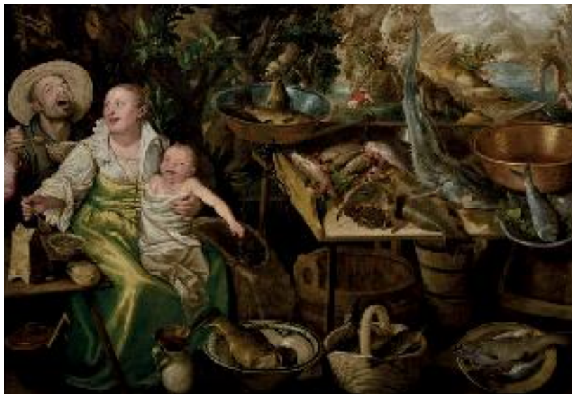
Vincenzo Campi , Pescivendoli ( Les Poissonniers ), 1579. Huile sur toile, 146 x 214 cm. La Roche-sur-Yon, musée municipal - Inv. 973.8.5