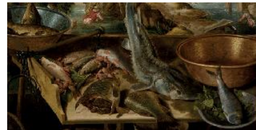
Vincenzo Campi, Les Poissonniers (détail) , 1579, La-Roche-sur-Yon, musée municipal - Inv. 973.8.5