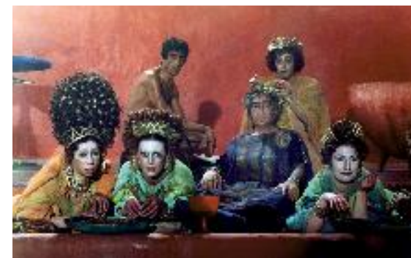
Fellini Satyricon, scène du banquet de Trimalchion

Tarif préférentiel pour les visiteurs de l'exposition (billet d'entrée à présenter en caisse) : 5 €