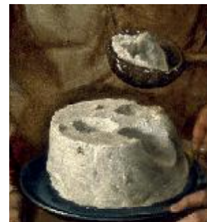
Vincenzo Campi, Mangeurs de ricotta (détail) , 1580, Lyon, musée des Beaux-Arts - Inv. H.673

Places limitées. Réservations au 03 23 73 06 06 (uniquement l'après-midi)