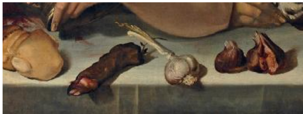
Bartolomeo Passerotti, Banquet caricatural ou Joyeuse compagnie (détail) , vers 1577, Paris, coll. particulière

Renseignements et réservations au 03 23 93 30 50