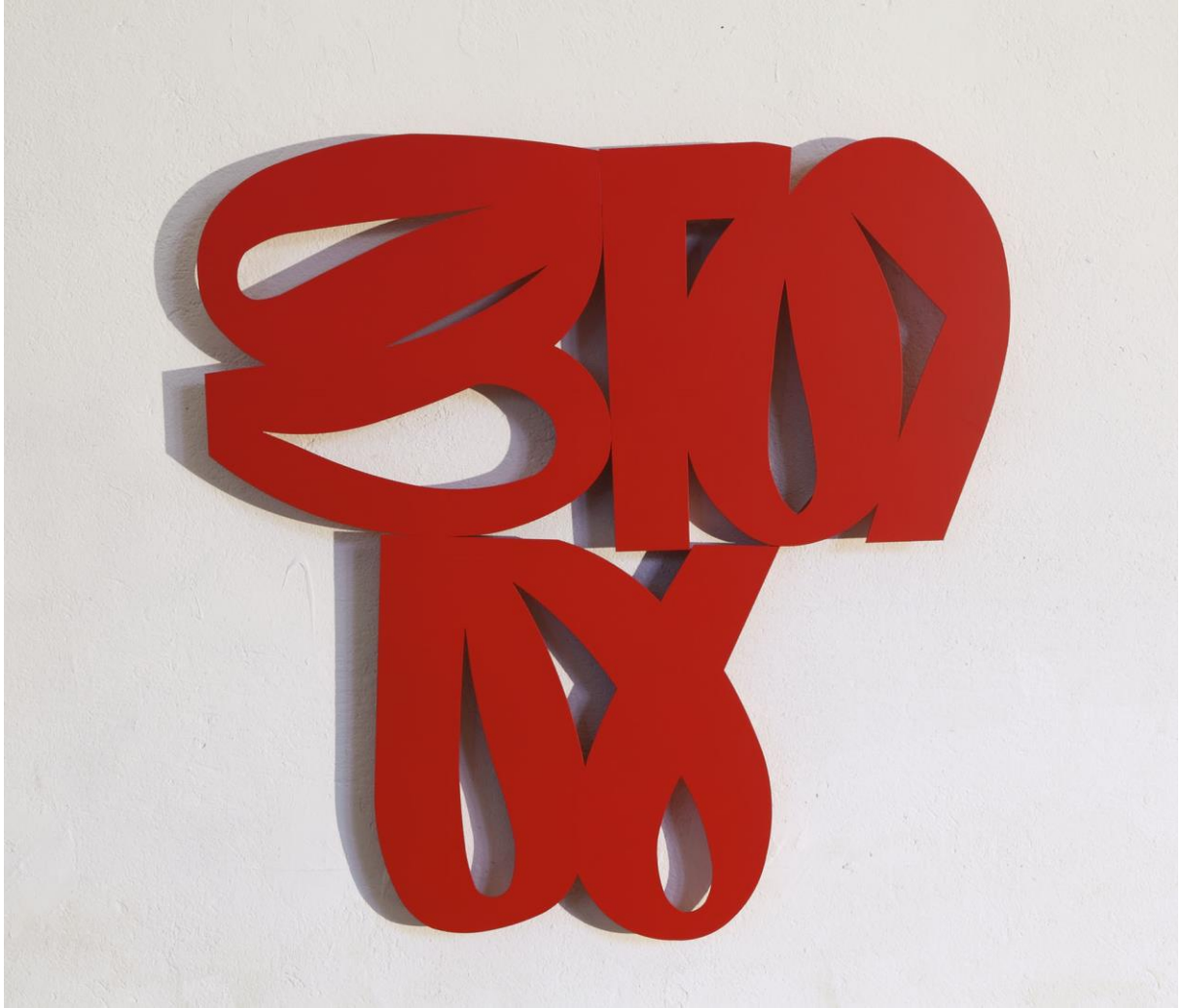
12 M 2 S, 2012, acier peint, 100 x 100 x 10 cm ; photographie Pierre Schwartz.