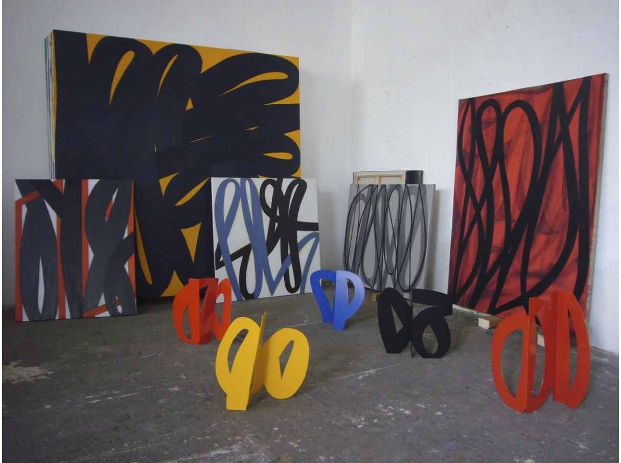
Atelier de Nîmes, 2015 ; photographie Alain Clément.