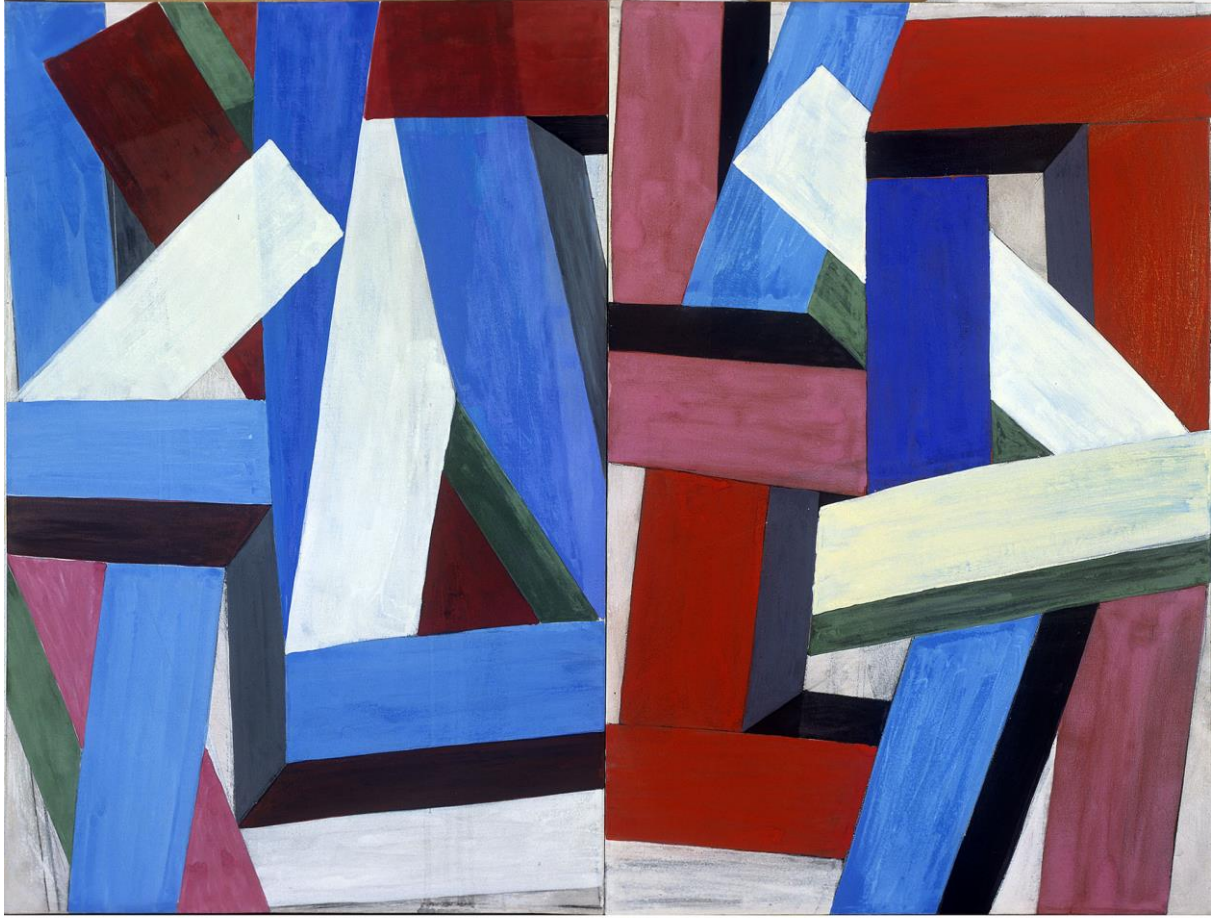
03 MA 16 P, 2003, huile/toile, 120 x 160 cm ; photographie Pierre Schwartz.