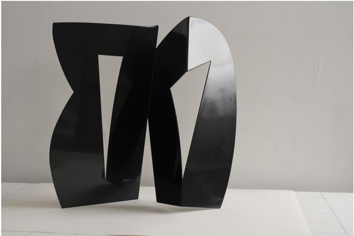
16 FC 1/4 S, 2016, acier peint, 50 x 50 x 15 cm