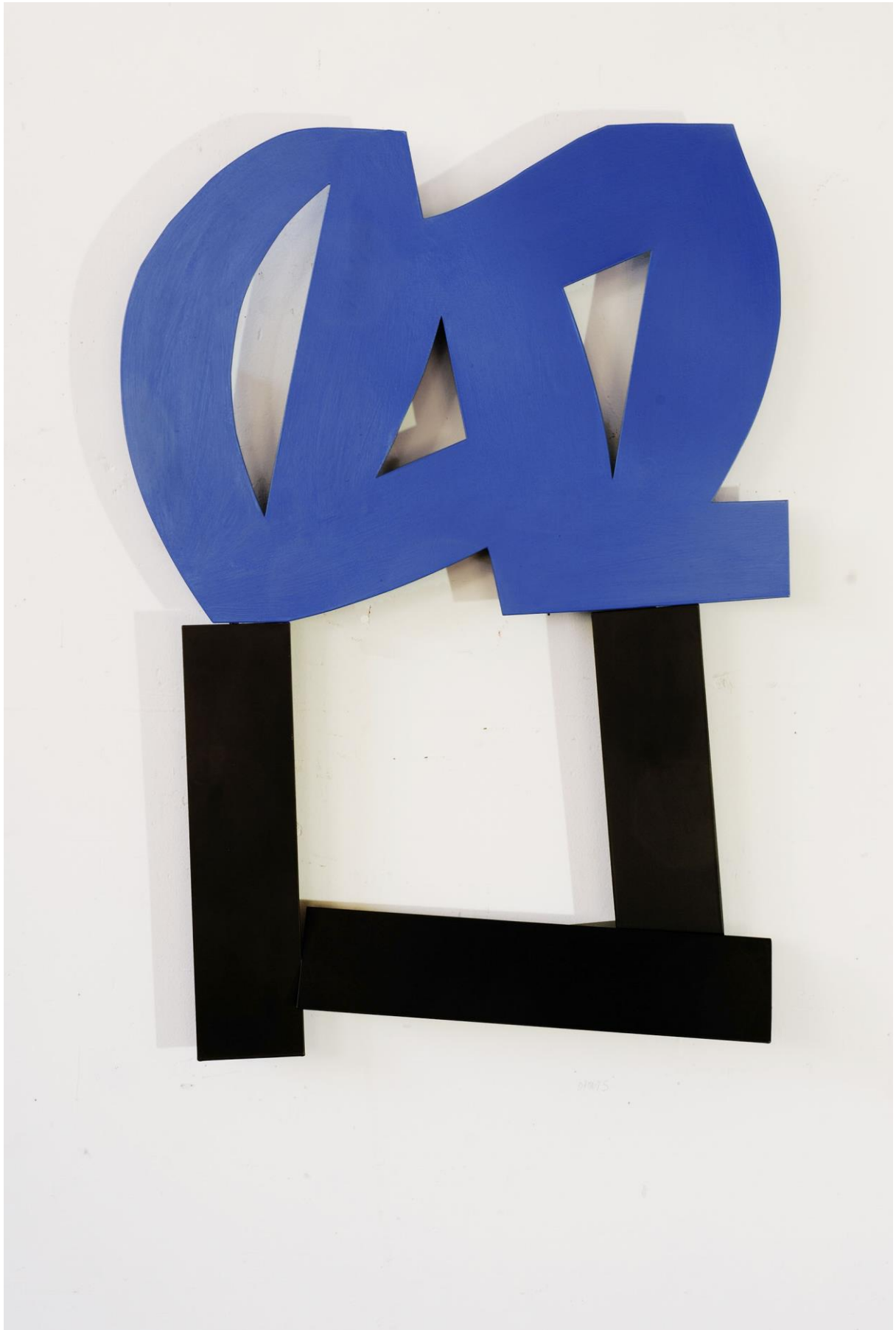
07 MA 1 S, 2007, acier peint, 87 x 62 x 10 cm ; photographie Pierre Schwartz.