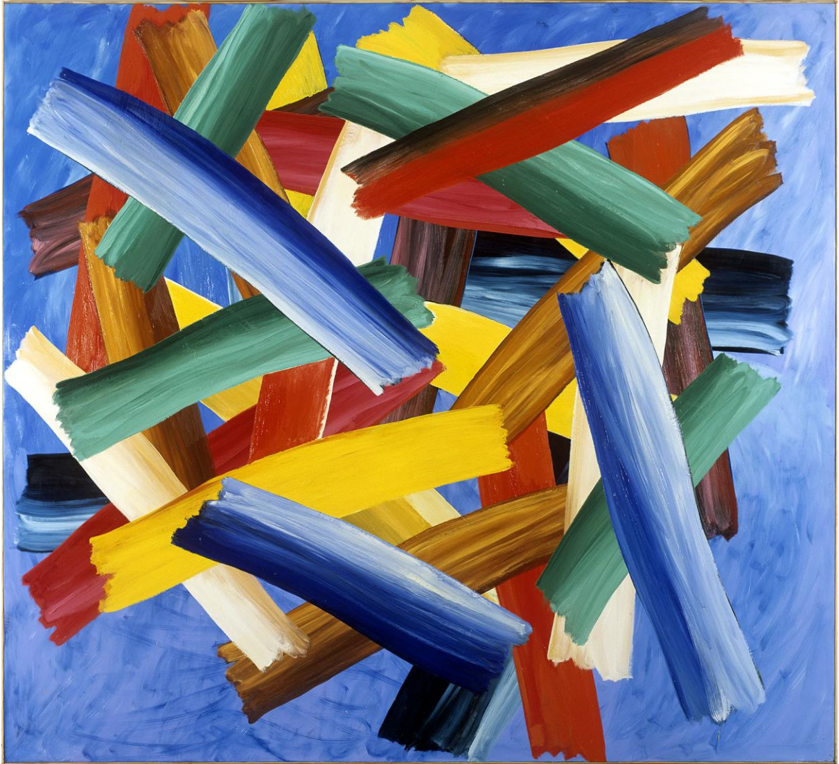
98 M 2 P, 1998, huile/toile, 200 x 220 cm ; photographie Pierre Schwartz.