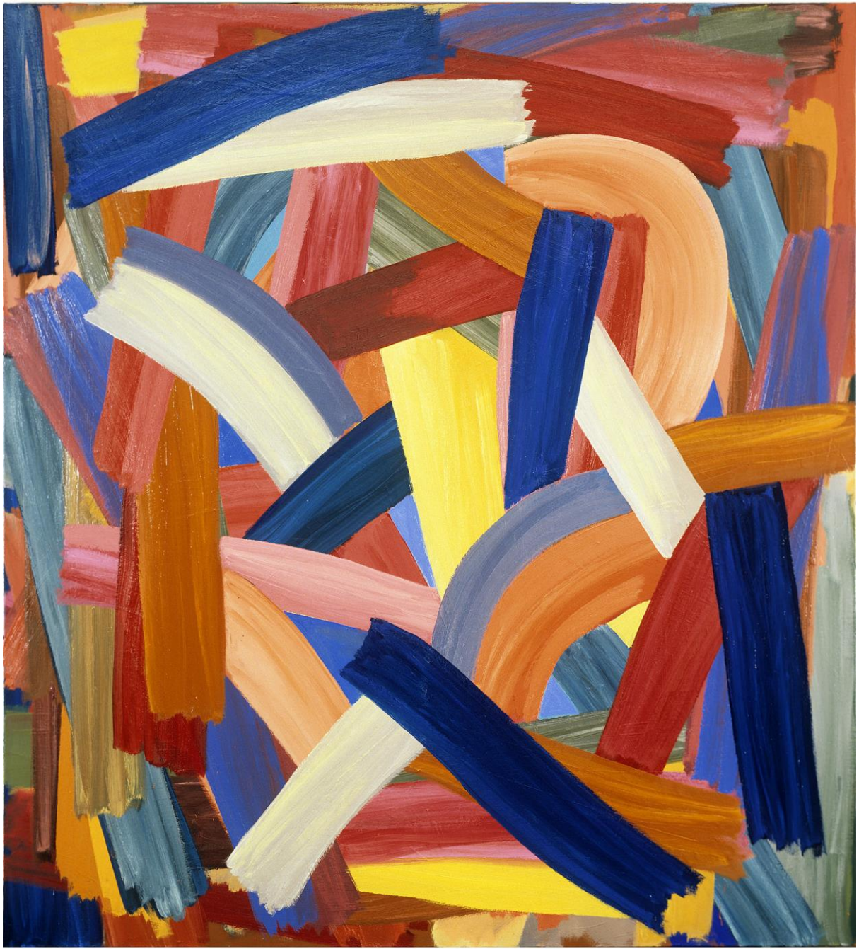
96 A 1 P, 1996, huile/toile, 220 x 200 cm ; photographie Pierre Schwart.