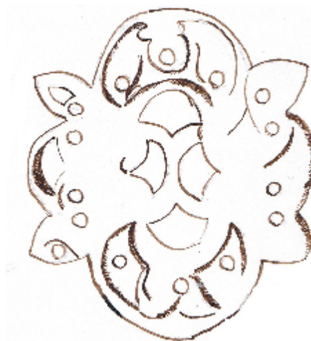
Plaque de Londres

Autre activité : rechercher différents types d'objets métalliques et les identifier ; comparer leurs usages différents et s'interroger sur le matériau utilisé, le rapport entre esthétique, matériau et usage.