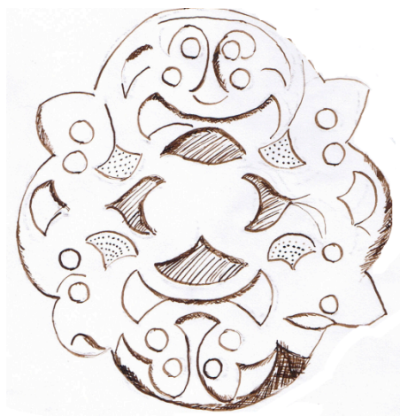
Plaque de Norton

Autre activité : observer les deux plaques de harnais suivantes et les comparer avec la plaque de Paillart.